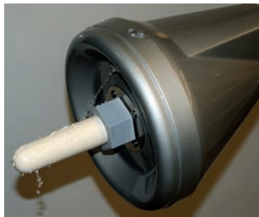
Propre jusqu'à l'extrémité

Le nettoyage automatique avant et après chaque cycle d'allaitement garantit une hygiène optimale. Comme le système ne contient pas de lait en dehors des heures de repas, les microbes ne disposent d'aucun milieu de