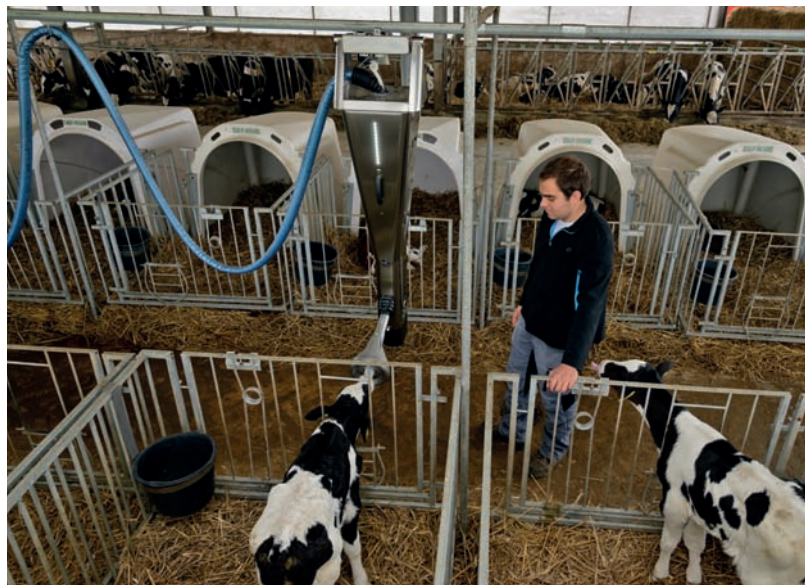
Beaucoup, souvent, toujours fraîche !