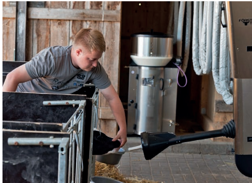
Un apprentissage simple & confortable

lite le contrôle des animaux au crépuscule et dans l'obscurité. Et qui incite de plus les veaux à boire à l'aide d'un signal acoustique.