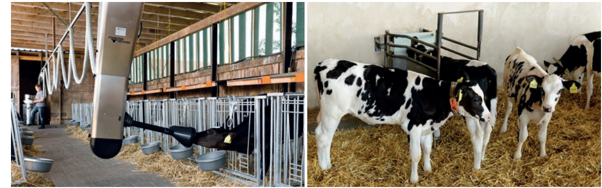
Approvisionner CalfRail & les lots avec un seul DAL

animal, toujours préparées à l'instant, jusqu'à 8 fois par jour. Le veau peut faire l'apprentissage de CalfRail et être ainsi nourri juste après son alimentation au colostrum. Les conditions optimales nécessaires à un élevage intensif sont ainsi réunies dès les tout premiers jours de la vie – et ce, sans la corvée des seaux.