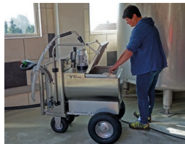
Tank couché avec bain-marie

Pour distribuer plus facilement de la buvée aux veaux placés dans des box individuels ou des igloos, Förster-Technik vous propose avec MilchMobil une solution confortable et robuste qui vous fera économiser, jour après jour, beaucoup de temps et d'énergie. Le chariot MilchMobil permet de mélanger, réchauffer, transporter et doser la buvée bien plus facilement et rapidement. Le chariot MilchMobil 4x4 de Förster-Technik existe avec une capacité de 120 ou 200 litres, ce qui convient de façon idéale aux différentes tailles d'exploitation.