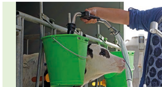
Unité de dosage simple et facile