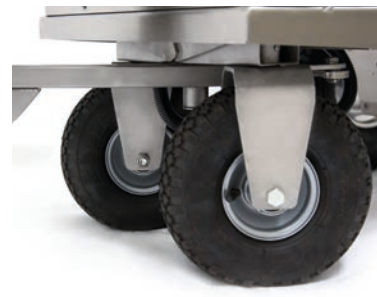
Demi-essieu oscillant et direction

Grâce à la buse de nettoyage rotative intégrée, le tank est confortablement nettoyé en quelques gestes en actionnant une touche. Le chariot MilchMobil 4x4 est ensuite rapidement à nouveau opérationnel.