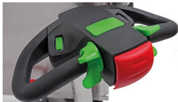
Tête du timon avec touches de fonction intégrées

MilchMobil 4x4 en série avec mixer, chauffage, nettoyage du tank, interface utilisateur, contrôle des portions, système d'entraînement à deux vitesses et DEL d'éclairage.