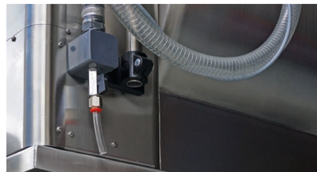
Vidange du tuyau flexible