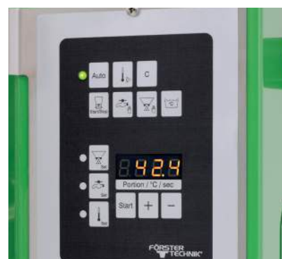
Une utilisation intuitive

Votre distributeur automatique pour agneaux et chevreaux est très simple et intuitif à utiliser grâce à son unité de commande compacte et à l'écran à 7 segments. Les quantités d'eau et de PDL peuvent être réglées séparément avec les touches de sélection directe grâce au menu des fonctions clairement structuré. Un compteur de portions permet de contrôler facilement la quantité de buvée distribuée.