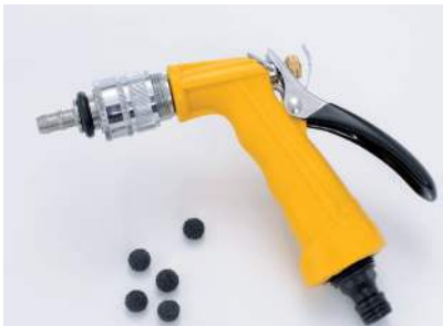
Pistolet de nettoyage des tuyaux

Le nettoyage semi-automatique du mixer est efficace et facile. Un simple bouton permet même d'avoir à cet effet de l'eau plus chaude. Le gobelet mélangeur ouvert et orientable est facile d'accès, ce qui permet de contrôler rapidement et à tout moment son fonctionnement. Vous pouvez éliminer facilement les dépôts présents dans les tuyaux d'alimentation et même nettoyer sans problème les tuyaux plus longs grâce au pistolet de nettoyage.