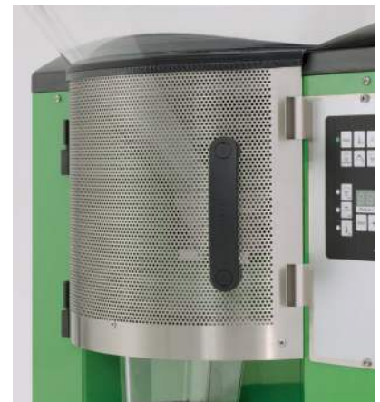
Grille de protection anti-mouches en option

La protection anti-mouches aux pores fins destinée au mixer empêche les mouches de s'introduire dans le gobelet mélangeur. Les pores et le grand volume permettent à la vapeur générée dans le gobelet mélangeur de s'échapper rapidement, ce qui évite la formation de condensation.