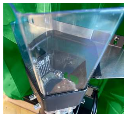
Chauffage du mixer disponible en tant qu'accessoire

Le chauffe-eau avec capteur de température, le système de régulation électronique du chauffage et la surveillance de la température minimale garantissent à tout moment la bonne température de la buvée qui peut être réglée et vérifiée simplement.